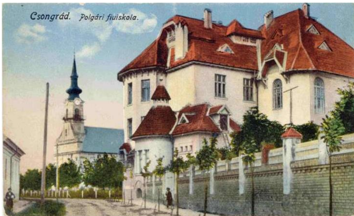
4. kép: A gimnázium udvar felőli része (gr. Apponyi utca felől) egy 1920 körüli képeslapon.