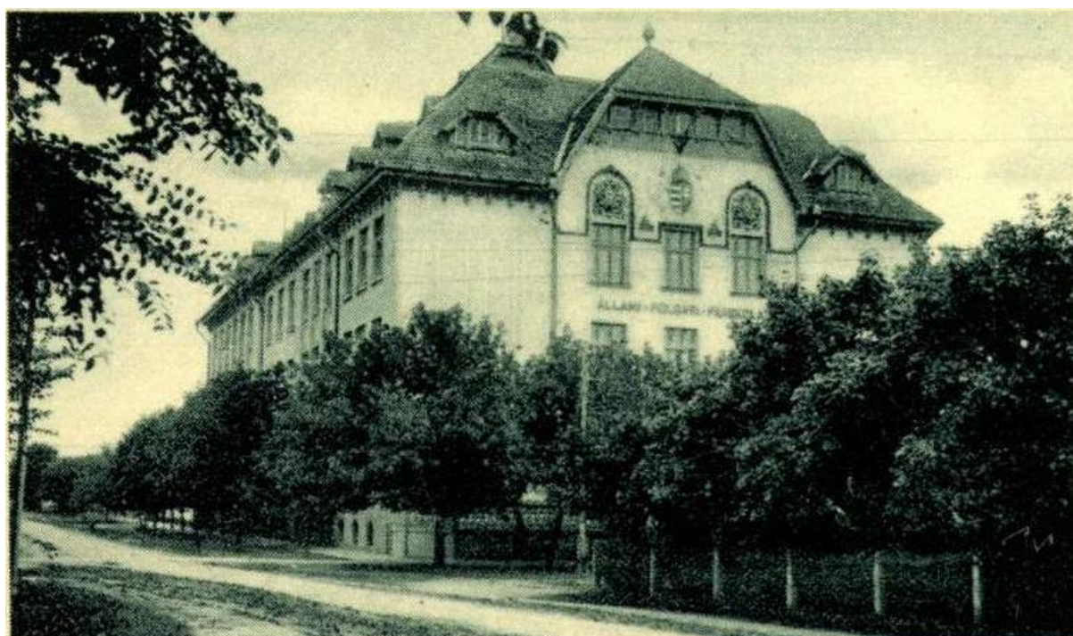
5. kép: A gimnázium főépülete egy 1937-ben postázott képeslapon (részlet).